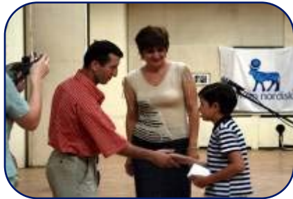
Творческий конкурс «КРОВные Узы» в Махачкале