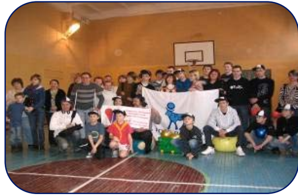
Летний лагерь в Санкт-Петербурге