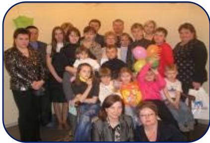
Школа гемофилии в Самаре