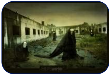
Выставка фоторабот Михаила Мозгового