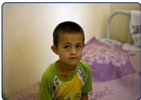
Что такое «фактор»?