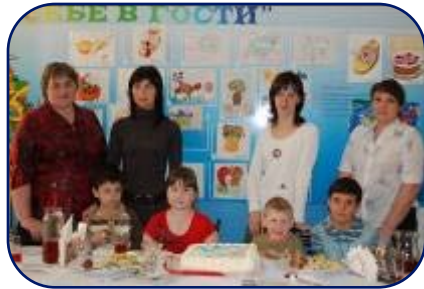
День гемофилии в Красноярске