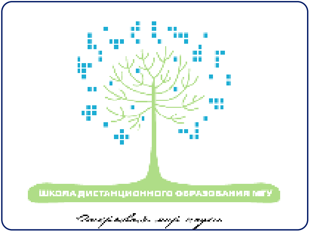
Современные подготовительные программы от МГУ

открываем новые возможности жизни с гемофилией